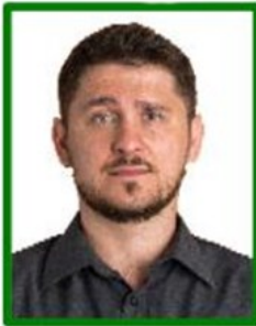
muy baja resolución