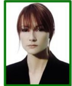
flequillo que cubre parte de la cara