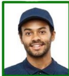
gorra que cubre parte de la cara