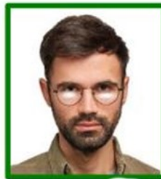
gafas que reflejan la luz