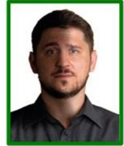
sombra en la cara