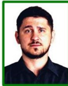
exceso de contraste