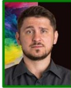
fondo oscuro con muchos elementos