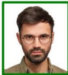
gafas que cubren parte de los ojos