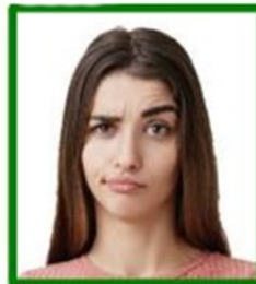
expresión facial antinatural